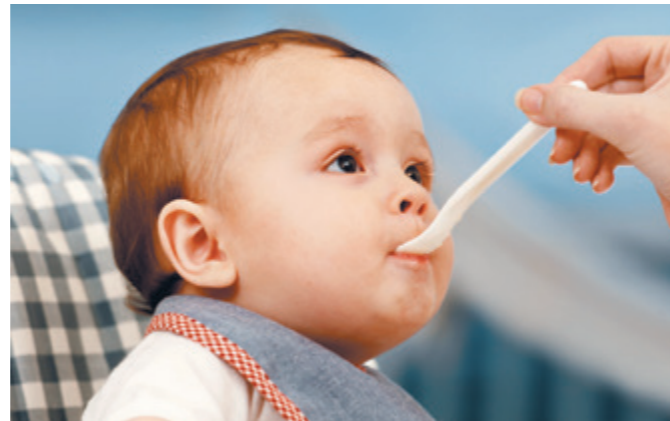
Den Breiöffel soll nur das Baby in den Mund nehmen, damit keine Kariesbakterien übertragen werden.

Planen Sie mindestens zweimal in der Schwangerschaft einen Zahnarztbesuch mit professioneller Zahnreinigung. Karies ist ansteckend!